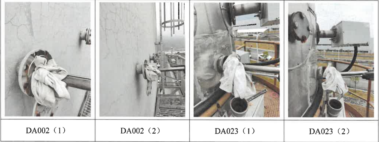
续附图 2：现场检测/采样照片