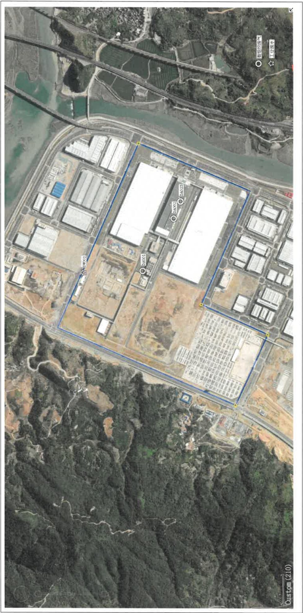
附图 1: 厂界检测点位示意图