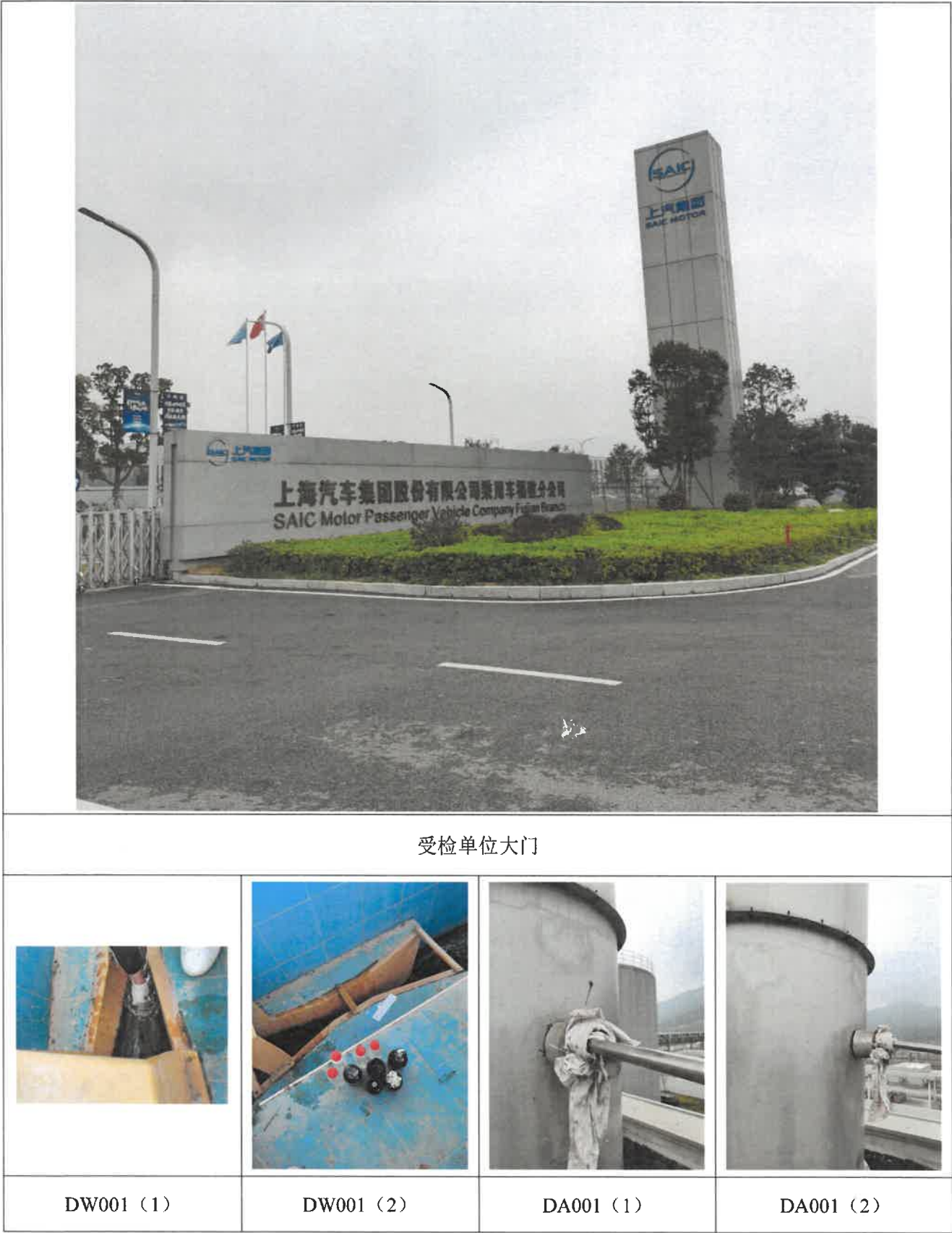
附图 2：现场检测/采样照片